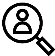
Family Security Office