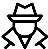
Onderzoek fraude & integriteit